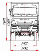
* - размеры при снаряженной массе